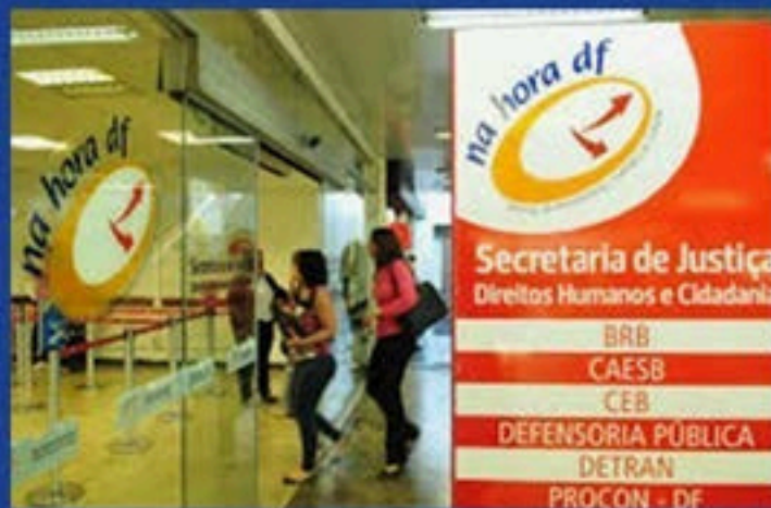
Postos do Na Hora

Para saber os endereços e horários dos postos de atendimento presencial, clique no link: